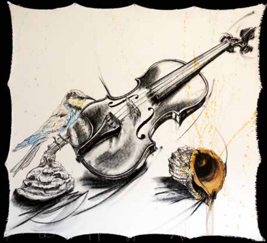
Musica Recordata | Stella Stefania Gagliano | 2023 100x90 cm, carboncino, creta e inchiostro su tela